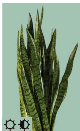
8: Sansevieria zeylanica