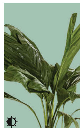
9: Chamaedorea metallica

*Pflanzen sollten dem Standort entsprechend kombiniert werden