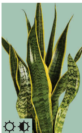
7: Sansevieria trifasciata „Laurentii“