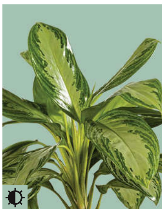
1: Aglaonema „Silver Bay“

Pro Gefäß können zwei Pflanzen* (zwei gleiche oder zwei unterschiedliche) ausgewählt werden: