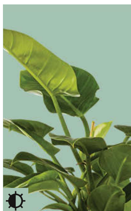
6: Philodendron „Imperial Green“