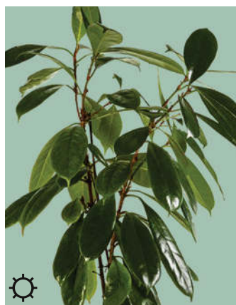
3: Ficus cyathistipula