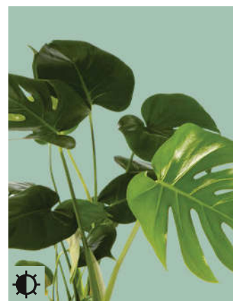
4: Monstera deliciosa