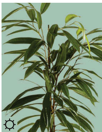
2: Ficus binnendijkii „Amstel King“